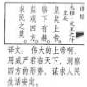
司馬遷: 史記, 封禪書, 28卷, 第6